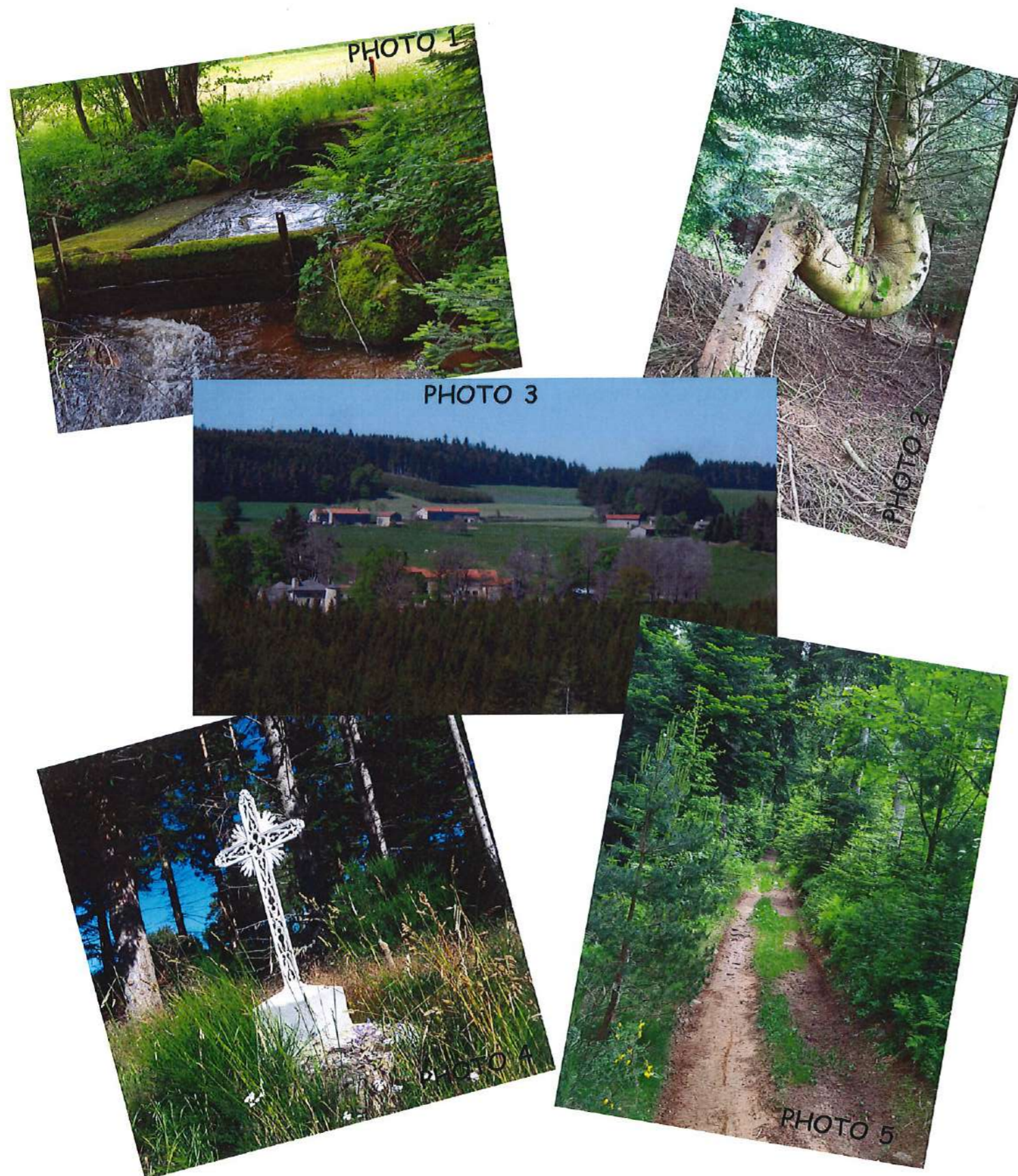
4- Croix en dessous de Chazelet en allant sur le Play / 5- Chemin entre la Nautre et les Fayettes