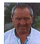
Bernard SOUVIGNET Président de la Communauté de Communes du Pays de Montfaucon