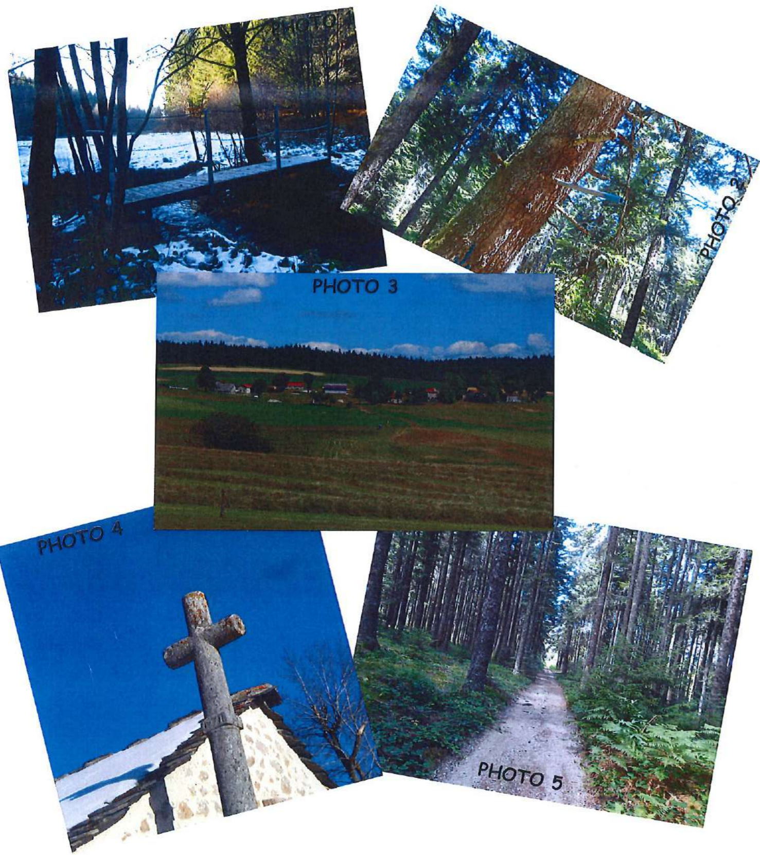
1 - Nouvelle passerelle sur le trifoulu / 2 - Des tuyaux poussent sur les arbres / 3 - Les Chomets / 4 - Croix du four banal / 5 - Chemin entre Rochedix et la Vigne