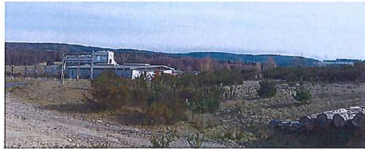
Zone d'activité du Cantonnier (Montregard)