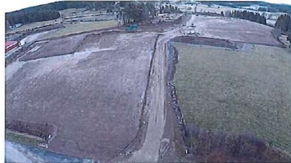
Zone d'activité d'Aulagny (Montregard)