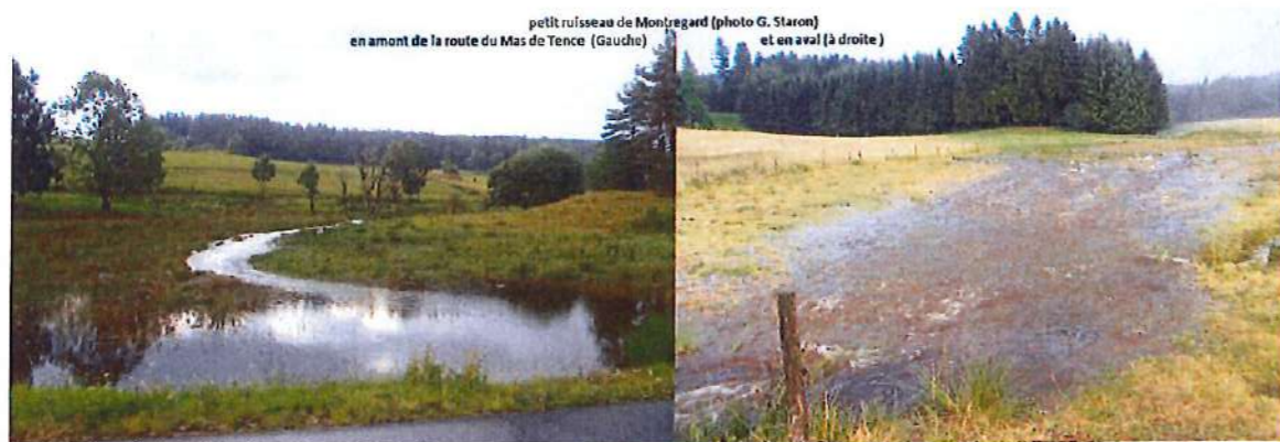
petit ruisseau de Montregard en amont de la route du Mas de Tence (Gauche) et en aval (à droite)

Cet axe montagneux du Mézenc au Pilat constitue une frontière climatique importante entre le domaine méditerranéen du côté rhodanien et un versant ligérien très sensible aux influences venant du nord. Ceci provoque de très gros orages dévastateurs. Ce n'est pas la première fois qu'il y en a eu deux la même année avec en 2017, le 22 juillet et surtout le 13 juin (226 mm à Landos). L'été le plus meurtrier a été 1963 avec un déluge pluvieux le 3 août sur le Haut Bassin du Doux et le 12 août un autre de grêle sur le Lignon vellave. La rivière était montée de plus de 2 m en deux heures au Chambon-sur-Lignon avec plusieurs victimes dans une colonie de vacances. Yssingeaux a été touché deux fois en juillet 1987 et surtout en mai 1996 (132 mm le 24). Sur le bassin de la Semène, il s'agit du 31 mai 1995 et sur Saint-Etienne, de juillet 1849 et 2009 et d'août 1994. La liste n'est pas exhaustive.